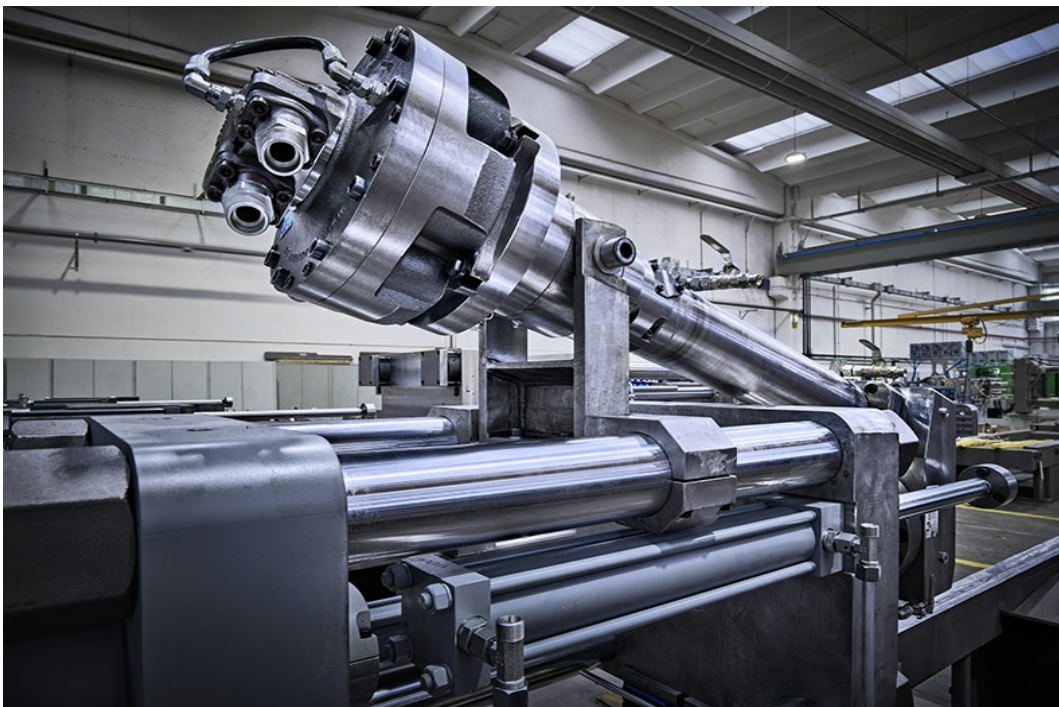
Copyright © Luca Campigotto, Img Macchine, particolare del gruppo iniezione di una pressa per stampaggio gomma.